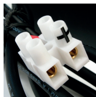
Minus- och pluspol.

Behörig elektriker bör anlitas vid installation.